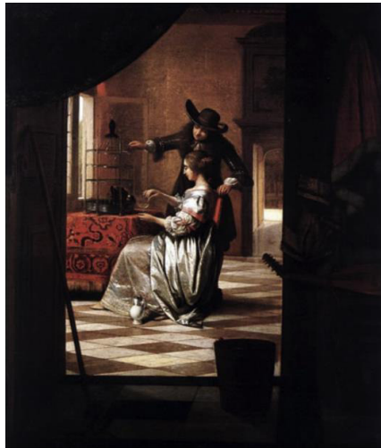
Pieter de Hooch, Le Couple au perroquet , 1668, huile sur toile, 73 x 62 cm, Cologne, Wallraf-Richartz-Museum