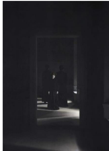
Désirée Dolron, Xteriors I , 2002, 99,3 x 71 cm